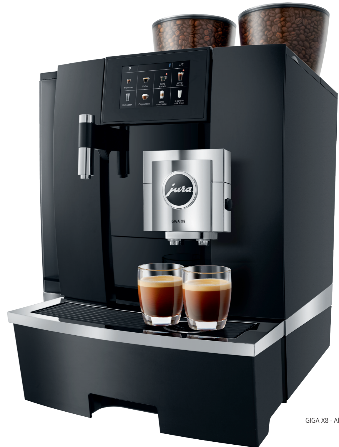
GIGA X8 - Aluminium Black (EA)

Meer informatie over de mogelijkheden vindt u op www.jura.nl